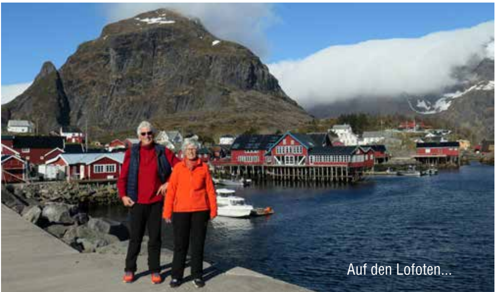
Auf den Lofoten...