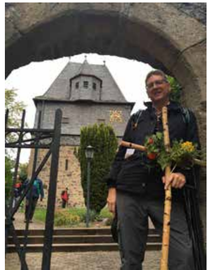
Ev. Kirche Salzböden 2020 – seit 2007 führe ich das Männerpilgern des Kirchenkreises durch. Stets geht das Kreuz voran; Zeichen dafür, dass nicht wir selbst der Mittelpunkt sind.

Wenn ich bei Gott ankomme mit meiner Sehnsucht, dann bin ich zuhause angekommen.