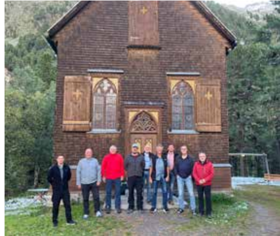
Unsere Männergruppe vor einer kleinen Kapelle neben dem Gepatschhaus, MW 2025.

Üblicherweise haben wir morgens mit kleinen Andachten und 4 Strophen aus „Laudato si, o mi signore“ und später auch abwechselnd mit „Wie die